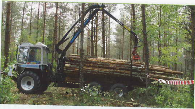
Lyftdiagram P25 med Vimek lyftcylinder